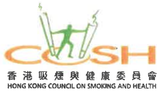
湯修齊 MH 太平紳士 香港吸煙與健康委員會主席